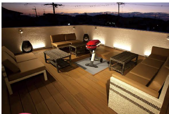
四国化成 色落ちにくい ファンデッキHG